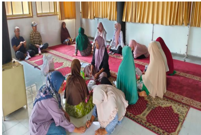
Gambar. 3 Suasana saat memberikan secara bertahap