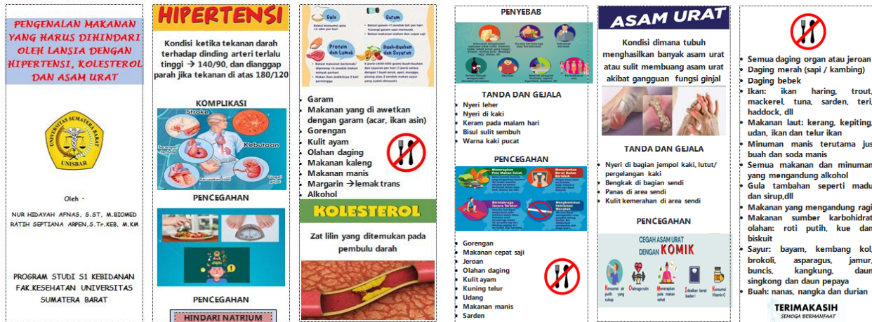
Gambar. 1 Lampiran leaflet

Setelah penyuluhan diberikan, dilanjutkan dengan diskusi dan tanya jawab dengan lansia. Terlihat lansia antusias dalam memberikan pertanyaan karena rasa ingin tahu dan semangat untuk sehat sehat tinggi. Mereka beranggapan jika di hari tua sehat maka tidak akan merepotkan anak dan cucunya. Lalu kegiatan di tutup dengan senam lansia serta pembagian makanan tambahan untuk lansia sebagai bingkisan.