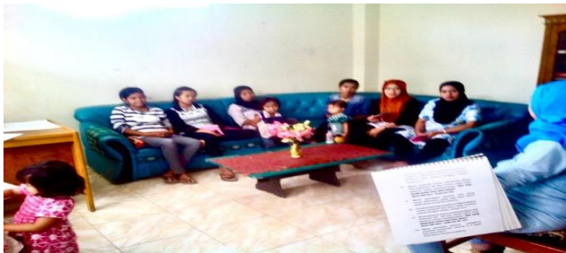
Gambar. 3 Suasana saat memberikan secara bertahap