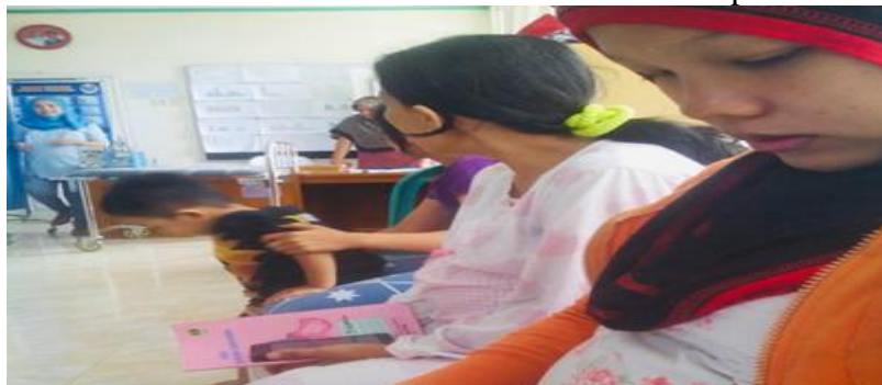
Gambar. 4 Diskusi dan tanya jawab oleh Ibu Hamil